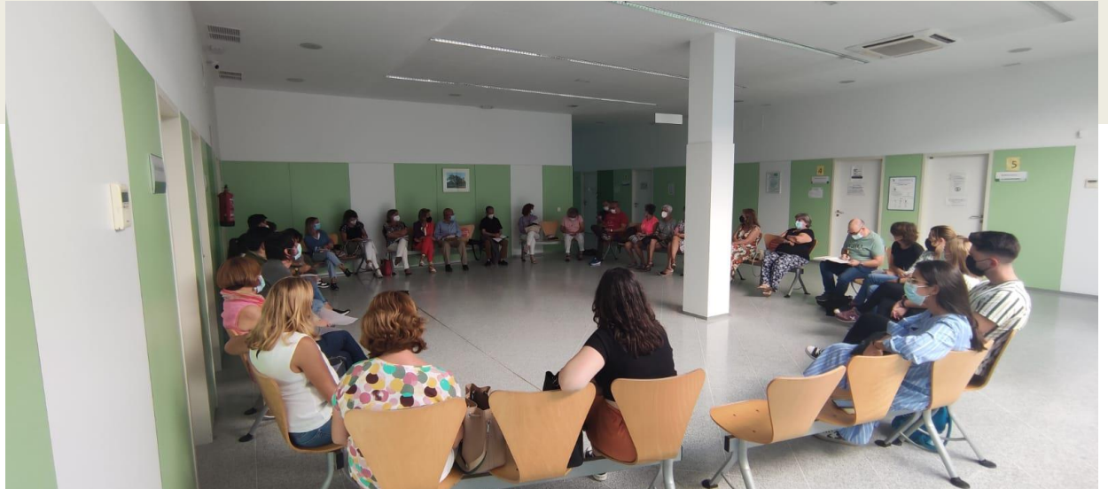
ENCUENTRO COMUNITARIO DE LA COMISIÓN EN EL CENTRO DE SALUD