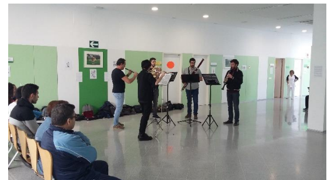
MÚSICA EN DIRECTO: alumnos del conservatorio superior de música de Badajoz amenizaron la sala de espera del centro de salud con música clásica en directo.

Sin duda una semana inolvidable para la barriada. Un agradecimiento a todos los colaboradores que hicieron posible este inmejorable cartel de actividades.