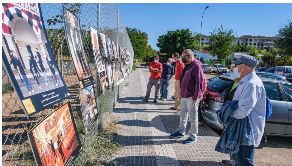
Inauguración de la exposición de imágenes

Reuniones organizativas: online entre los participantes