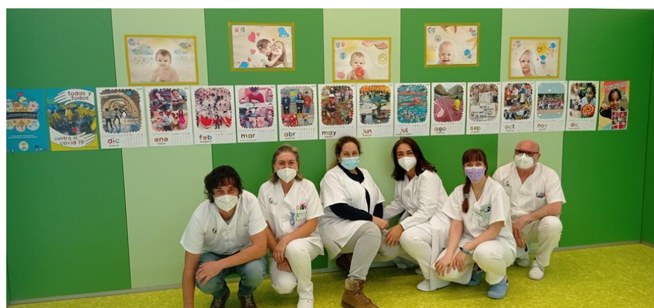
Exposición de calendario solidario en centro de salud