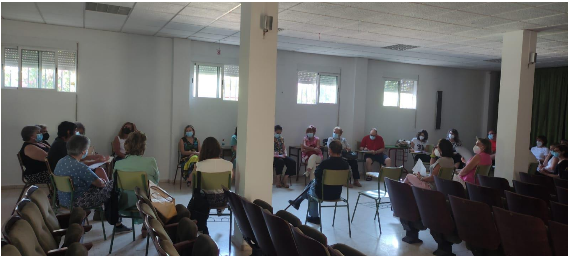
Parroquia San Pedro de Alcántara. Junio 2021