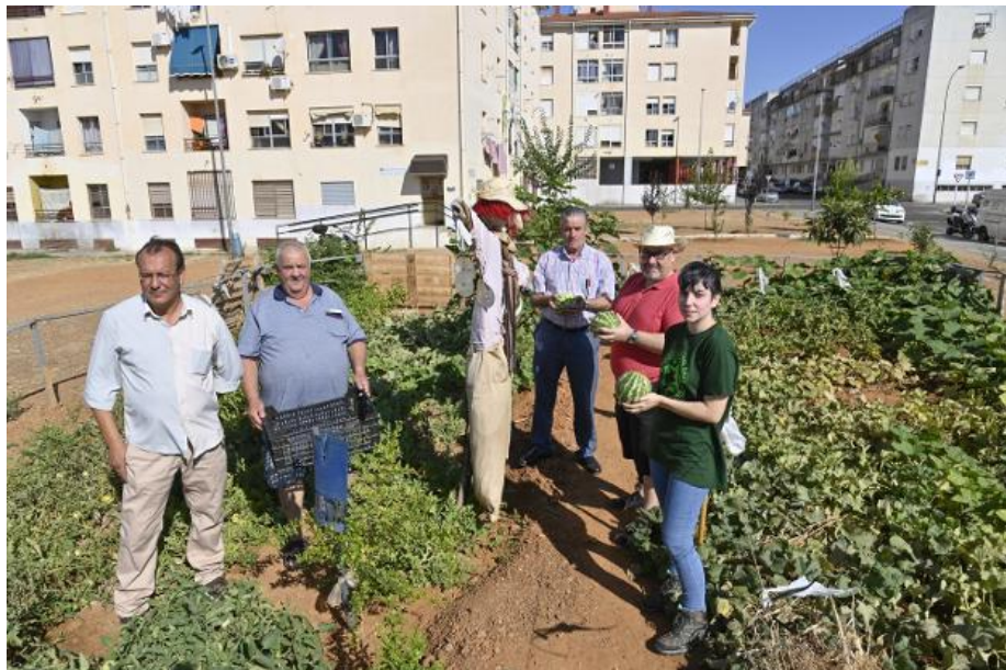
Miembros de la Asociación de Vecinos en el huerto urbano