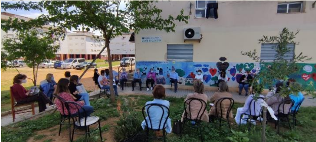
REUNIÓN COMUNITARIA EN LA ASOCIACIÓN DE VECINOS