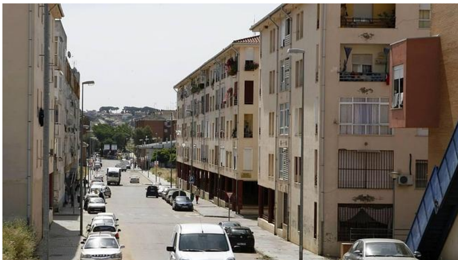
Imagen de archivo de la barriada Suerte Saavedra

22 de febrero de 2021: desde el Gabinete de Presidencia se comunica que se procede a trasladar esta necesidad a las administraciones competentes, Secretaría General de Administración Digital, Secretaría General de Educación y Gerencia de Área de Salud.