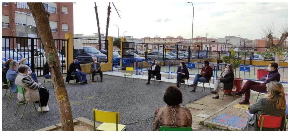
Miembros de la Comisión Comunitaria de Salud. Marzo 2021

Equipo de Salud Mental (área salud de Badajoz): proyecto de salud emocional llevado a cabo por los residentes de la especialidad en Salud Mental y coordinado por la Unidad Docente y tutores.