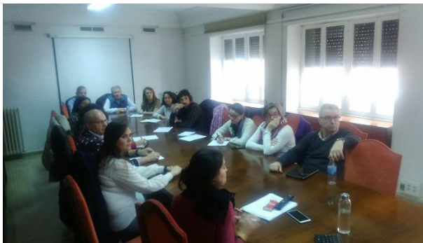
REUNIONES DE FORMACIÓN: equipo comunitaria durante una actividad formativa