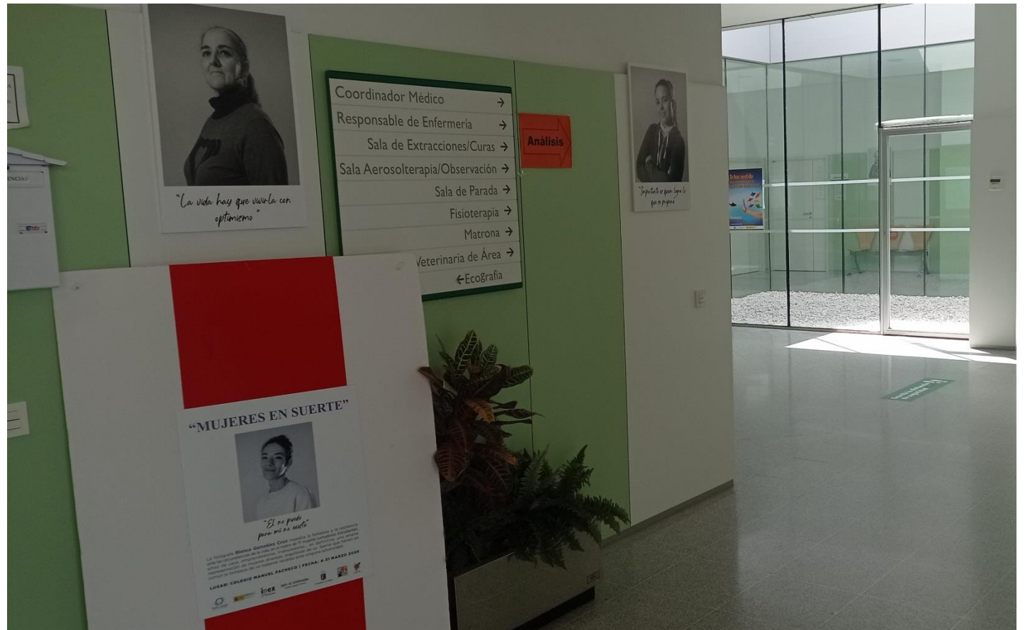
EXPOSICIÓN FOTOGRÁFICA "MUJERES EN SUERTE"