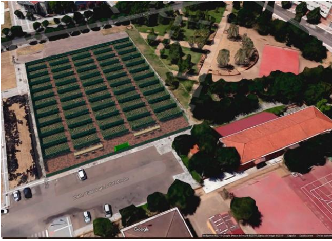
PROYECTO DEL HUERTO URBANO