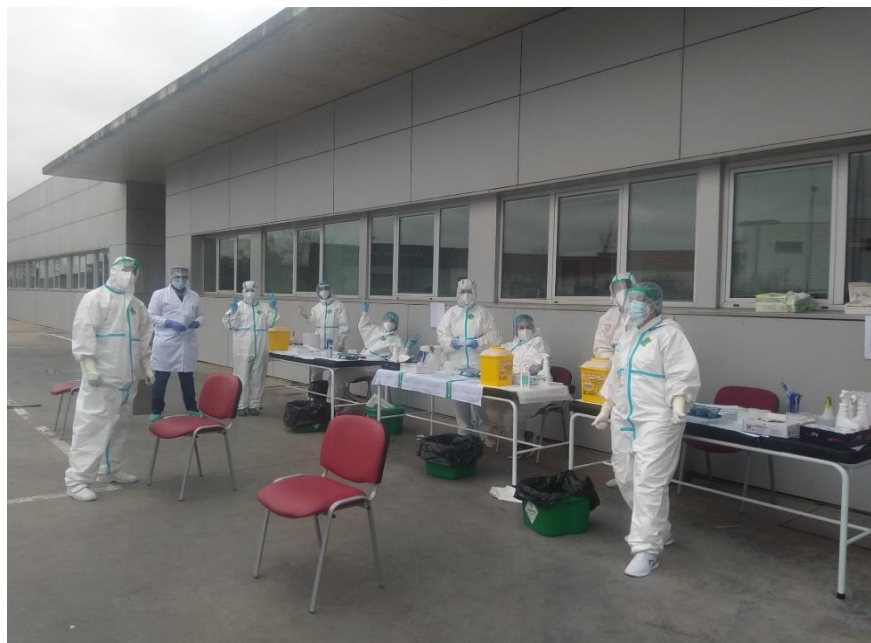
Personal sanitario del centro de salud durante la toma de muestras

26 de enero de 2021: (EAP) organización de toma de muestras (gestión de citas y formación de grupos)