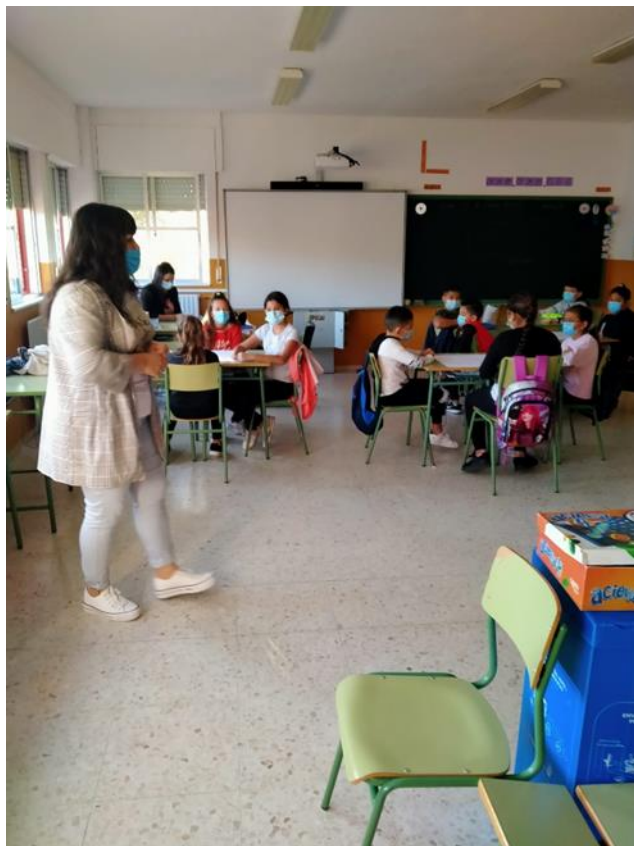
Actividad desarrollada en el CIEP Manuel Pacheco

Reuniones organizativas: incluidas dentro del proyecto