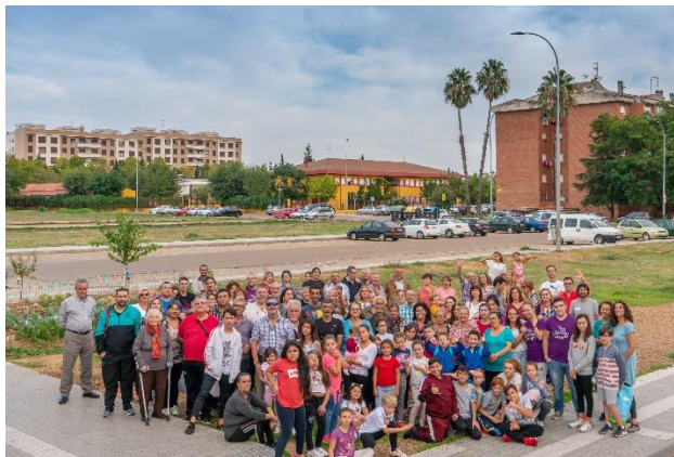
FOTO PORTADA DIAGNÓSTICO SALUD COMUNITARIO. 2018