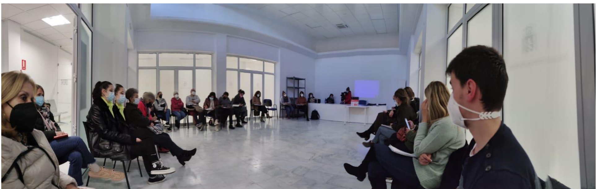
Centro Social. Noviembre 2021