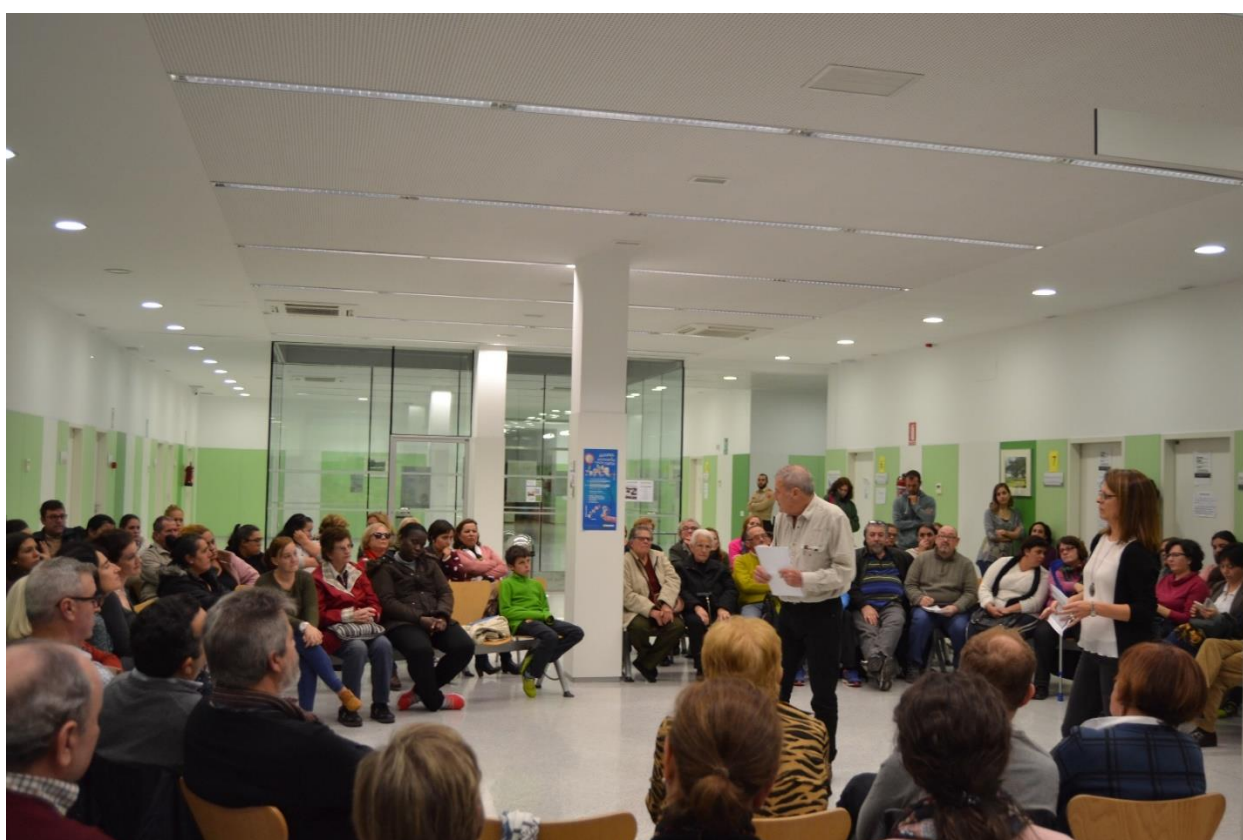
Acto de encuentro comunitario para presentar la constitución de la Comisión Comunitaria de Salud de Suerte de Saavedra. Febrero de 2017. Centro de Salud.