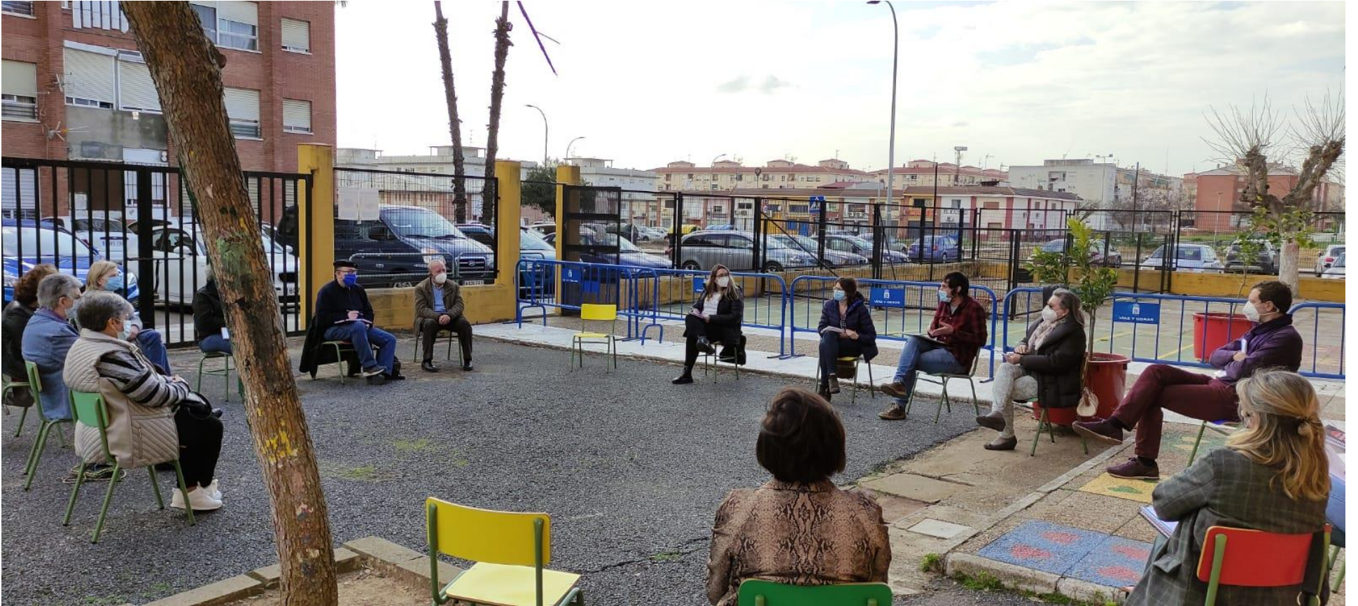
CIEP Manuel Pacheco. Marzo 2021