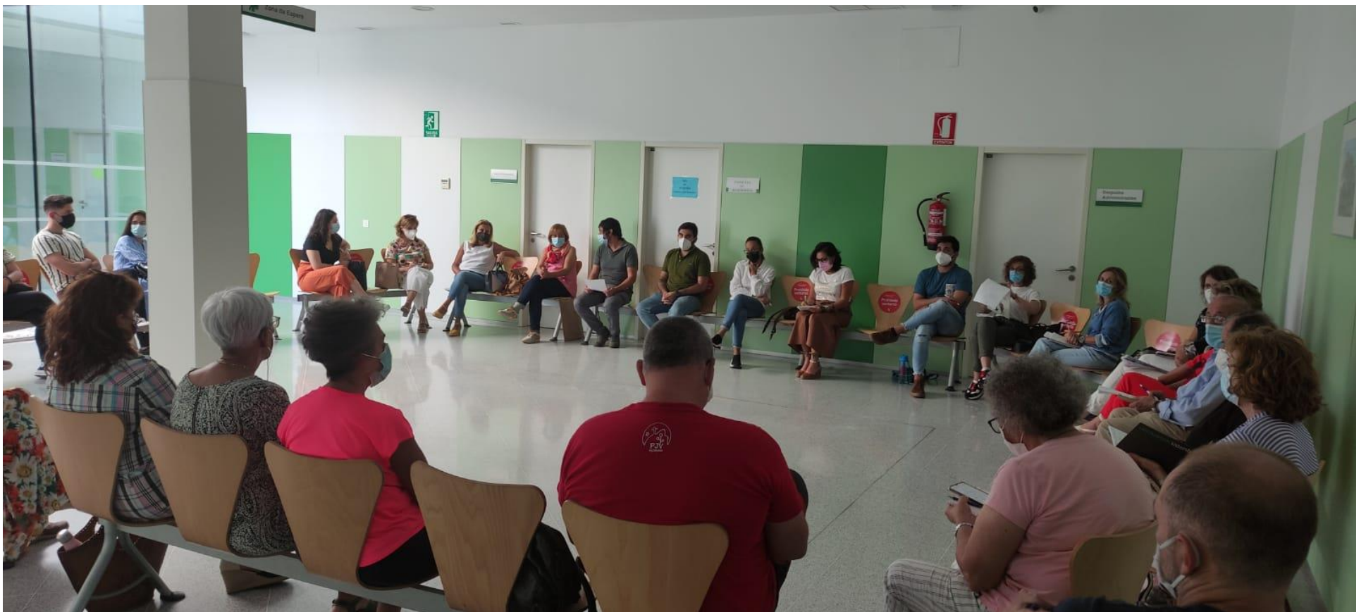
Centro de Salud. Septiembre 2021