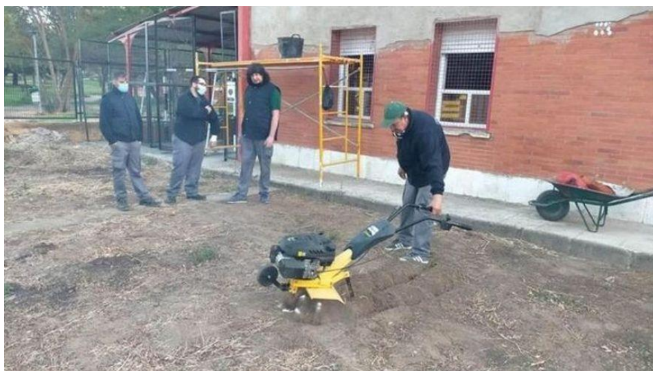
Miembros del programa Crisol durante las actividades