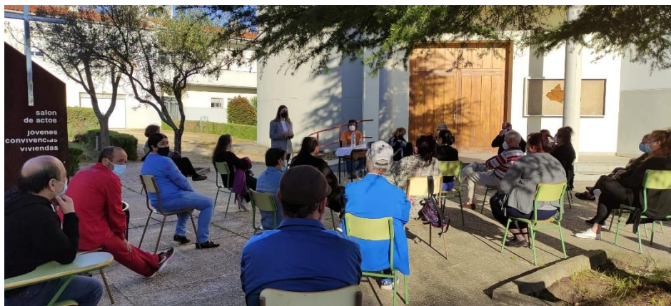
Charla al grupo del Programa de Inserción de la Mujer. Centro Parroquial. Marzo de 2021