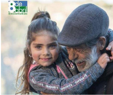
50 ANIVERSARIO FUNDACIÓN SECRETARIADO GITANO