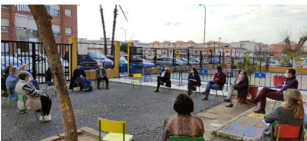
COMISIÓN REUNIDA EN EL CIEP MANUEL PACHECO

La Comisión Comunitaria de Salud que aglutina todas las fuerzas vivas del barrio, no cesa de impulsar y transmitir dinamismo y vida. Con esta experiencia de trabajo común nos reafirmamos en la necesidad de potenciar redes que aúnen nuestros avances en la barriada.