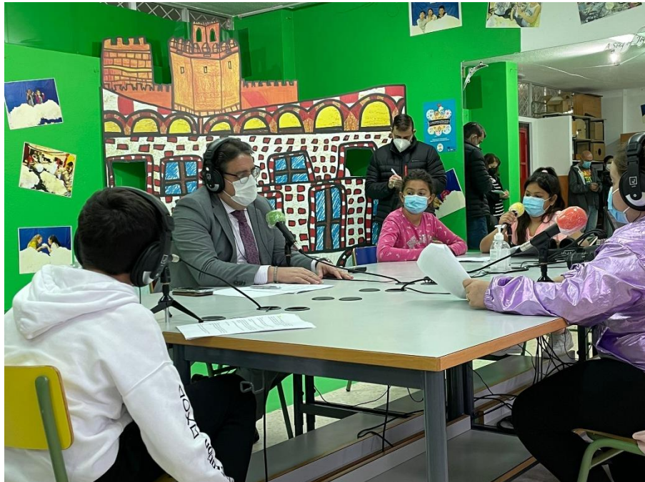
El Consejero de Sanidad en la radio escolar del CIEP Manuel Pacheco

Reuniones organizativas: el equipo de RADIO EDU se reúne de forma semanal, para preparar los programas con el alumnado