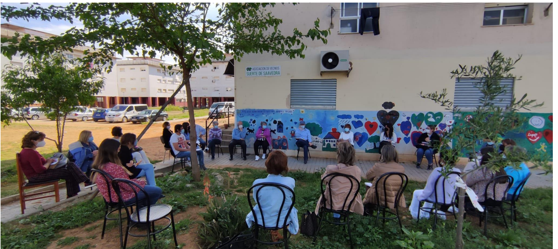
Asociación de Vecinos. Abril 2021