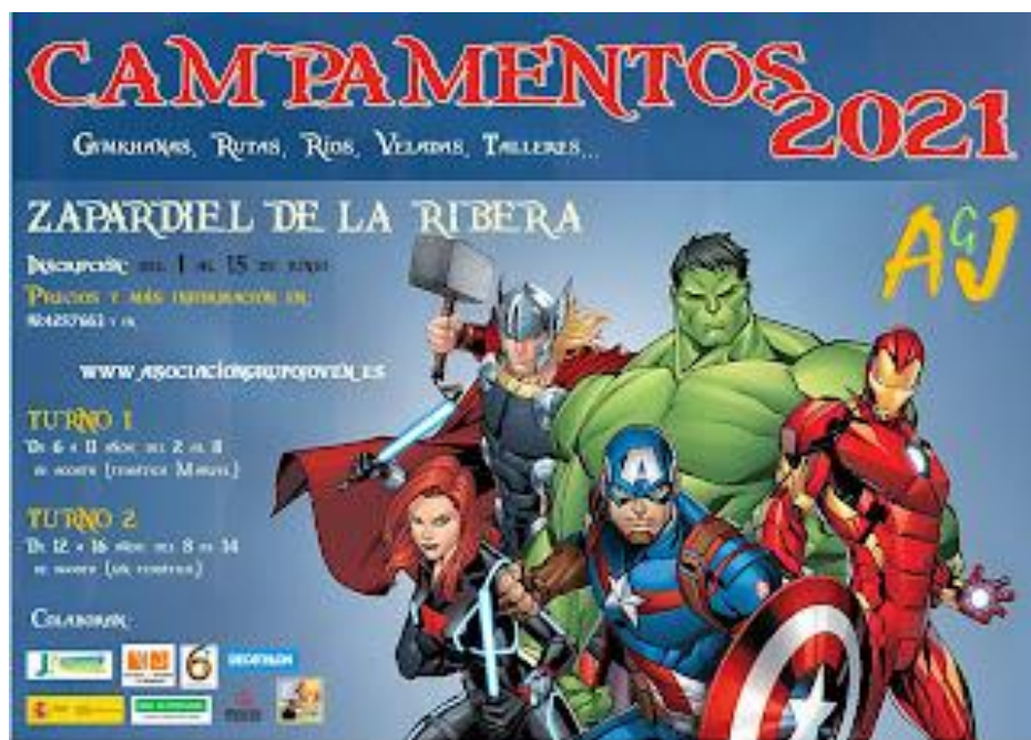
Cartel publicitario del campamento de verano de AGJ

Reuniones organizativas: las realizadas durante el curso