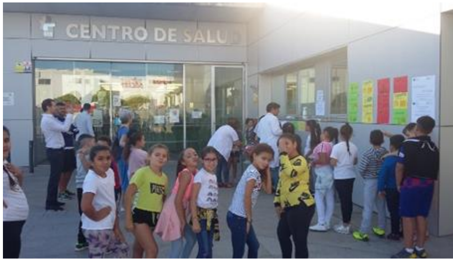
ACTIVIDAD SEMANA DE LA SALUD: escolares del CIEP Manuel Pacheco pesándose en la entrada del centro de salud

Durante los años que nuestra Comisión Comunitaria esta activa, se han desarrollado dos semanas de la salud , donde se han realizado diferentes actividades: abordaje del sobrepeso escolar y actividad física y alimentación saludable, y el bienestar asociado a la música, al baile o a la danza.