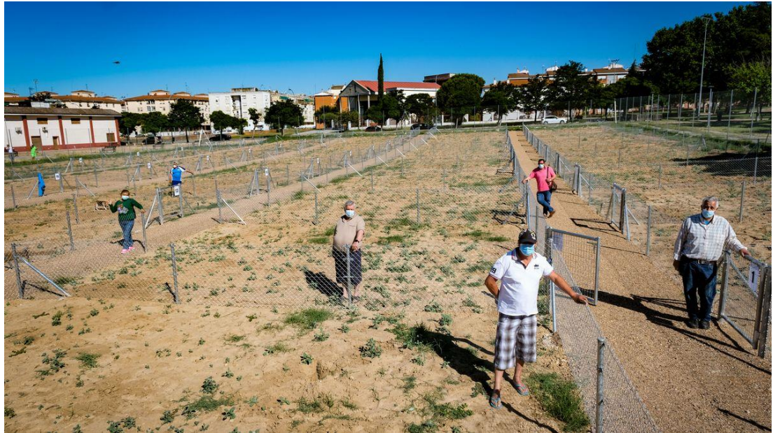
Entrega de las primeras parcelas

https://www.hoy.es/badajoz/alejandro-labrador-huerto-20210722000810-ntvo.html