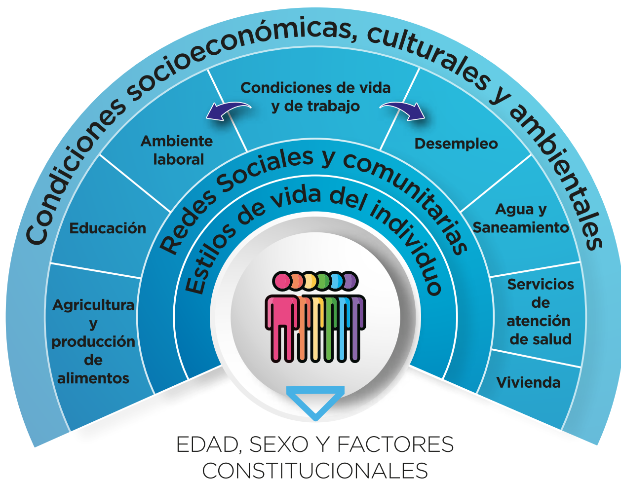
Figura 1: Modelo de Determinantes de la Salud de Dahlgren y Whitehead (1991). Modificado de: Guía Metodológica para integrar la Equidad en las Estrategias, Programas y Actividades de Salud, Ministerio de Sanidad.

Pero sobre todos los otros niveles están las condiciones económicas, culturales y medioambientales prevalecientes en la sociedad en su conjunto. Estas condiciones, como el estado económico del país y las condiciones del mercado de trabajo, producen presión sobre cada una de las otras capas.